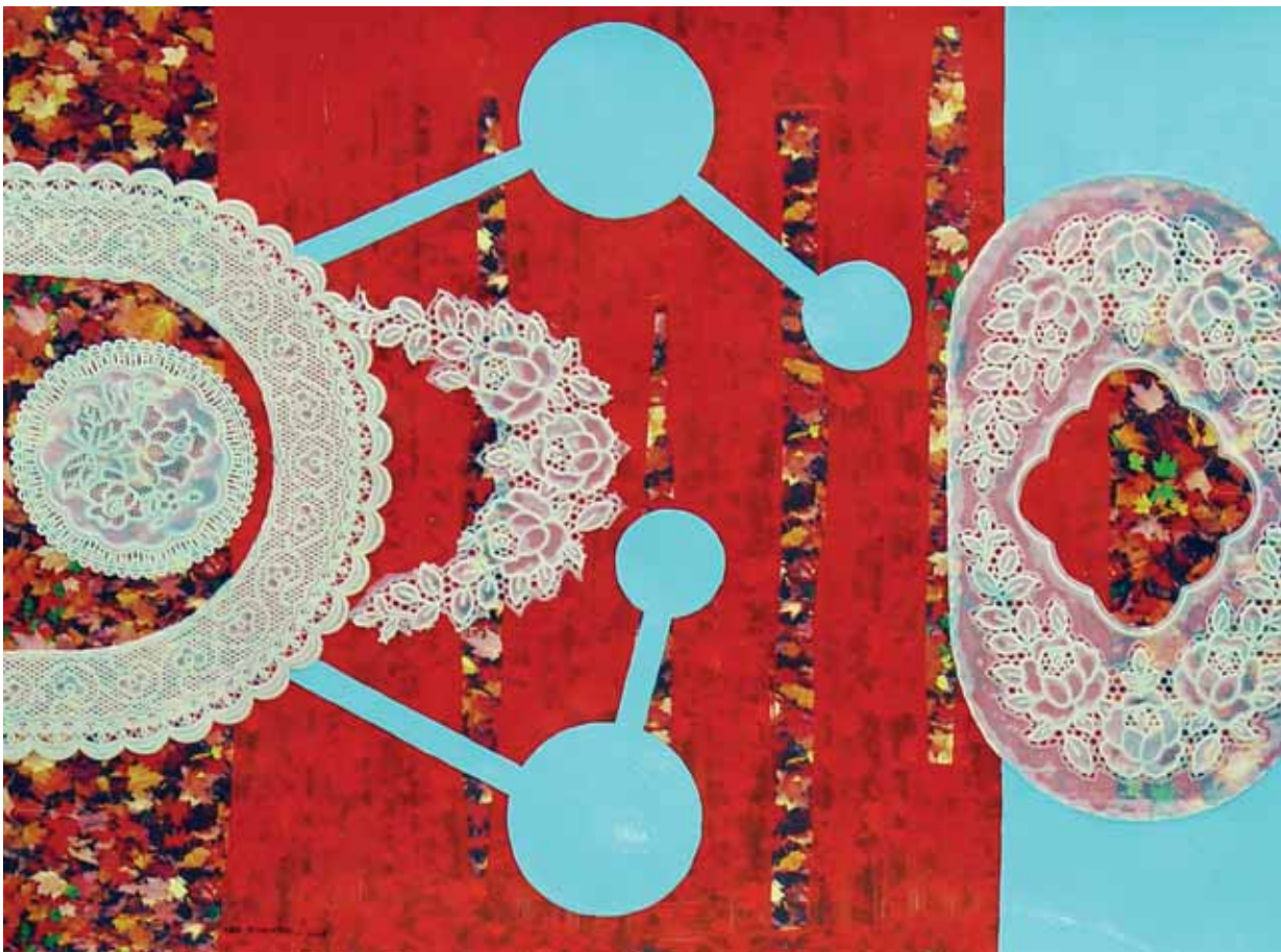
On the way Home , 2008 - técnica mista s/papel - 49.5 X 68 cm