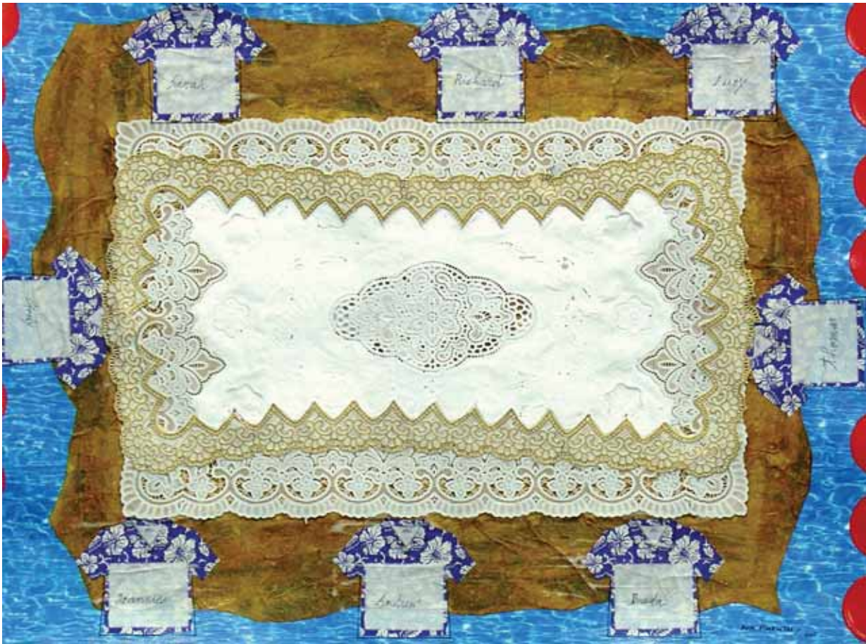
The Banquet , 2008 - técnica mista s/papel - 49.5 X 68cm