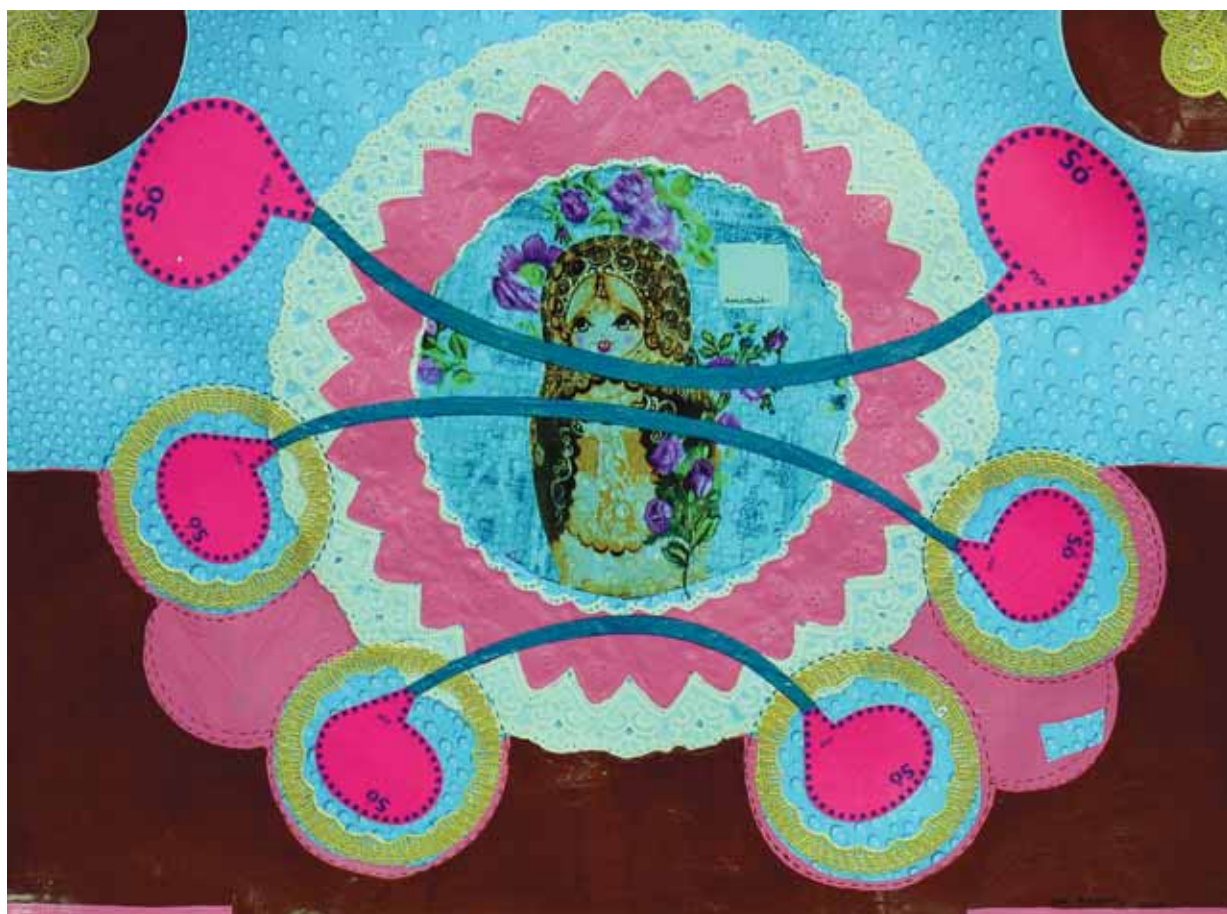
Souvenir , 2008 - técnica mista s/ papel - 49.5 X 68 cm