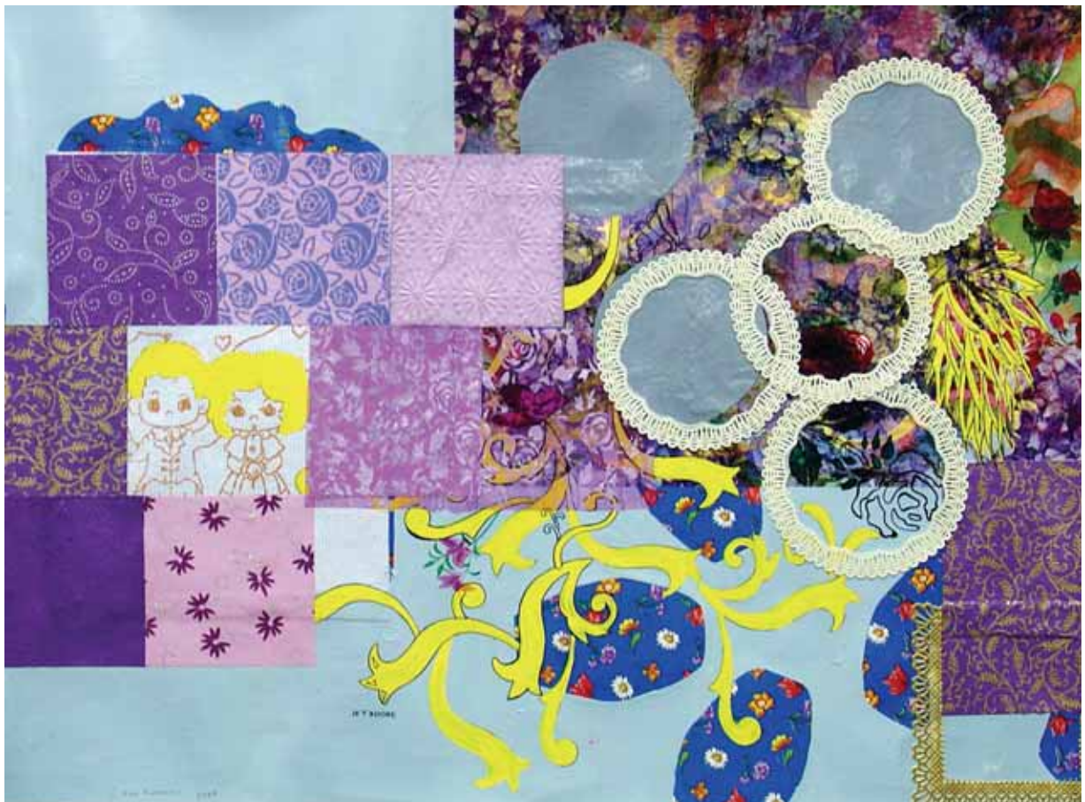
Souvenir , 2008 - técnica mista s/ papel - 49.5 X 68 cm